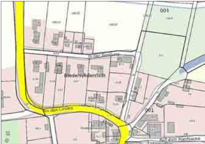
Auszug: geoportal.thueringen.de (unmaßstäblich)