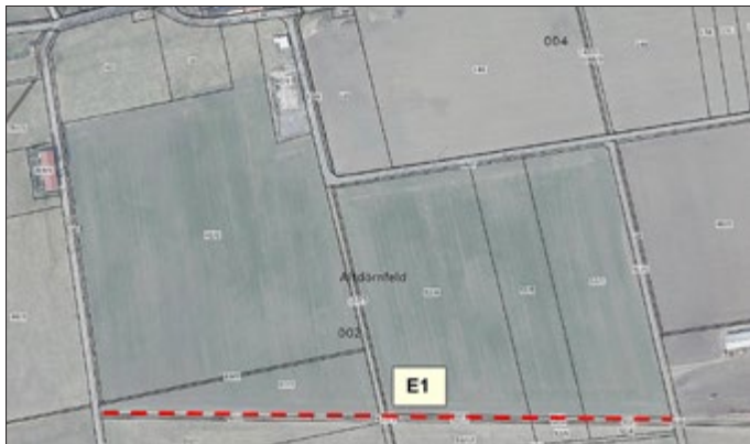
Abbildung 1: Lage der Baumpflanzung (rote Strichlinie, Darstellung symbolhaft) südlich von Altdörnfeld - Auszug aus geoproxy.thueringen - unmaßstäblich

Lage der externen Ausgleichsfläche als Ersatzfläche E 1 für den naturschutzfachlichen Ausgleich Flurstücke 62/2, 52/11, 52/12, 52/6, 52/7, 52/3 und 52/2 in der Flur 2 der Gemarkung Altdörnfeld