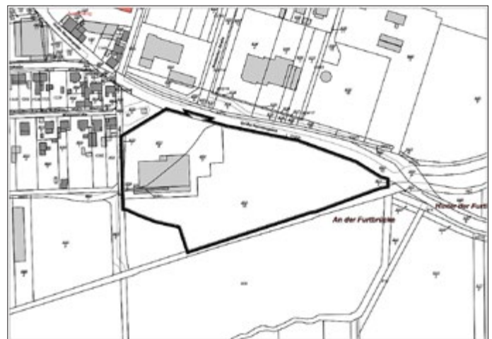
Geltungsbereich des Bebauungsplans „Verlagerung REWE-Markt“ 1. Änderung (fett umrandet)

Flurstücke: 859/1, 859/2, 852/8, 852/9, 852/10, 852/7 und 850/10