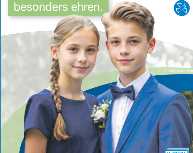
Bild KI generiert

Anzeige online aufgeben unter wittich.de/jugendweihe